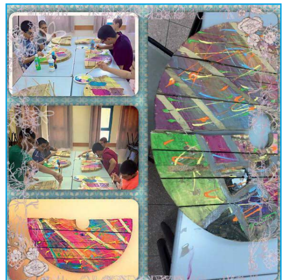
קבוצת "רעים" באקה אל גרבייה בפעילות אמנותית.