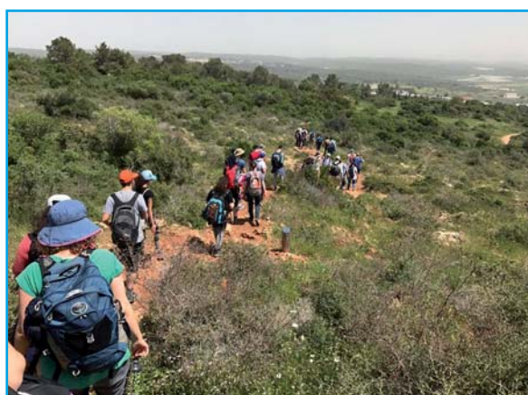
עם בוא האביב יצאנו, כ-100 משתתפים מכל הארץ, לטיול באזור זיכרון יעקב והכרמל.