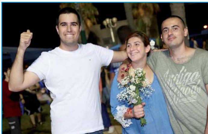
וכמיטב המסורת - את סוף השנה ציינו במסיבת קיץ רטובה ומצננת בברכת קדימה.