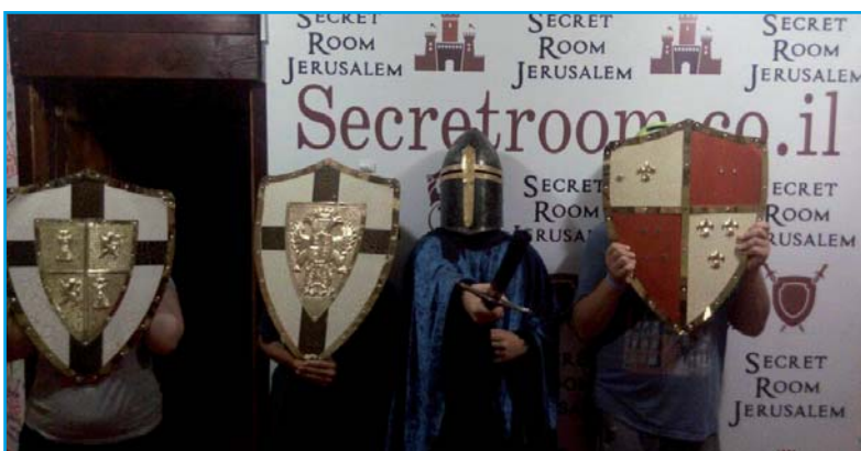
קבוצת מעלה אדומים - בכילוי בחדר בריחה.