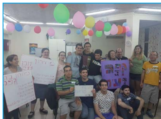
קבוצת הרצליה בהכנות לפעילות.