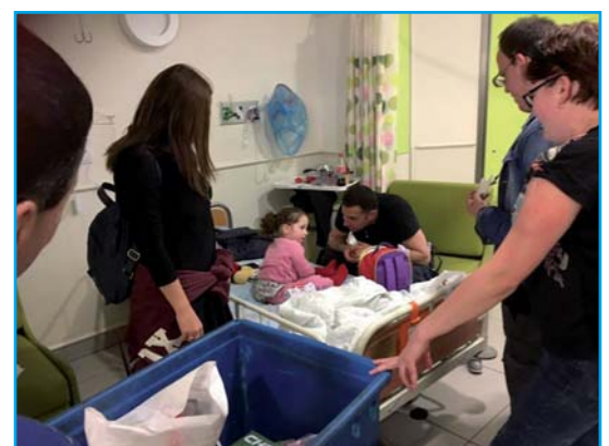
משתתפי קבוצת הבוגרים של רחובות ביום התנדבות בביה"ח קפלן.