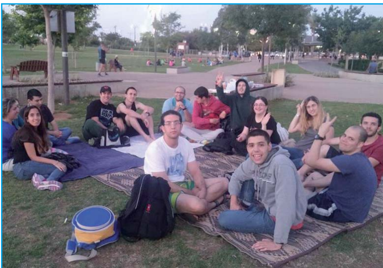
מבלים בפארק - קבוצת הצעירים של הרצליה וקבוצת "רעים" פתח תקווה.

לחגוג ימי הולדת, לצאת לפארק או למסעדה, ליצור, להתנדב ולבלות יחד. כמה טוב שיש חברים!