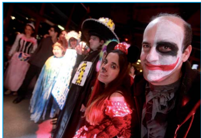
באדר מרבים בשמחה. מסיבת פורים ענקית, עם תחרות תחפושות מסורתית, מופע מבדר, מוזיקה וריקודים. תודה ל"עדה על המים" שאירחו אותנו בנדיבות רבה.